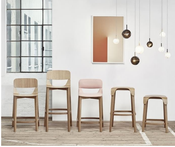
استوديو روما X ديشيم، النجم الساطع والنجم المظلم

يعود 'داون تاون ديزاينز'، معرض التصميم التجاري الرائد في منطقة الشرق الأوسط، مجدداً إلى دبي في الفترة بين 13-16 نوفمبر 2018، وذلك بمشاركة أكثر من 175 علامة تصميم متميزة من المنطقة وشبتي أنحاء العالم. وسيقدم 'داون تاون ديزاينز' هذا العام مفهوماً جديداً يتمثل في 'داون تاون إديشنز'، وهو معرض فني منظم بعناية يعنى بالتصاميم حسب الطلب ومحدودة الإصدار ومجموعات التصميم المخصصة ومبادرات التعاون بين المصممين. وسيشهد معرض 'داون تاون إديشنز' في توحيد أساليب التصميم المختلفة في المنطقة، حيث ستتشارك الجهات المنظمة من كل من عمّان وبيروت والدار البيضاء بتنظيم هذه الفعالية التي ستسلط الضوء على مجموعة من أبرز مواهب التصميم في الشرق الأوسط. وتحت شعار 'مدن صالحة للعيش'، سيضم المعرض لهذا العام حديقة داخلية من شركة 'ديزرت إنك' المتخصصة بتصميم المساحات الطبيعية، بالإضافة إلى المفاهيم والأعمال التركيبية الإبداعية المؤقتة لمجموعة من المصممين المعروفين عالمياً. كما سيشهد المعرض تنظيم فعاليات "المنتدى" الذي سيضم محادثات وحوارات حول القطاع بمشاركة أكثر من 25 رائداً من مشهد التصميم الدولي.